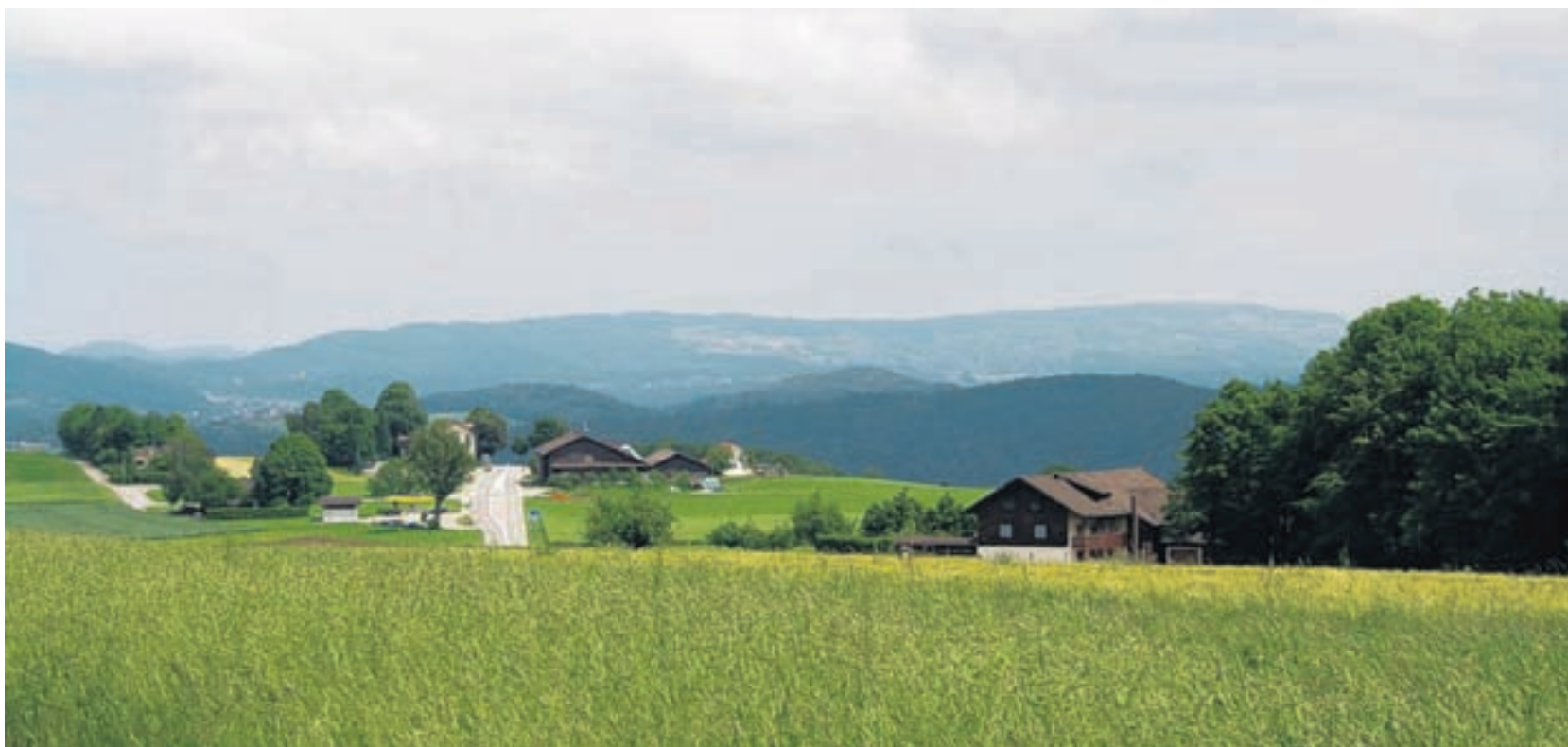
Idylle. Diese Gegend auf dem Bözberg ist ein möglicher Atommülllager-Standort (Blick vom Bözberg Richtung Brugg).