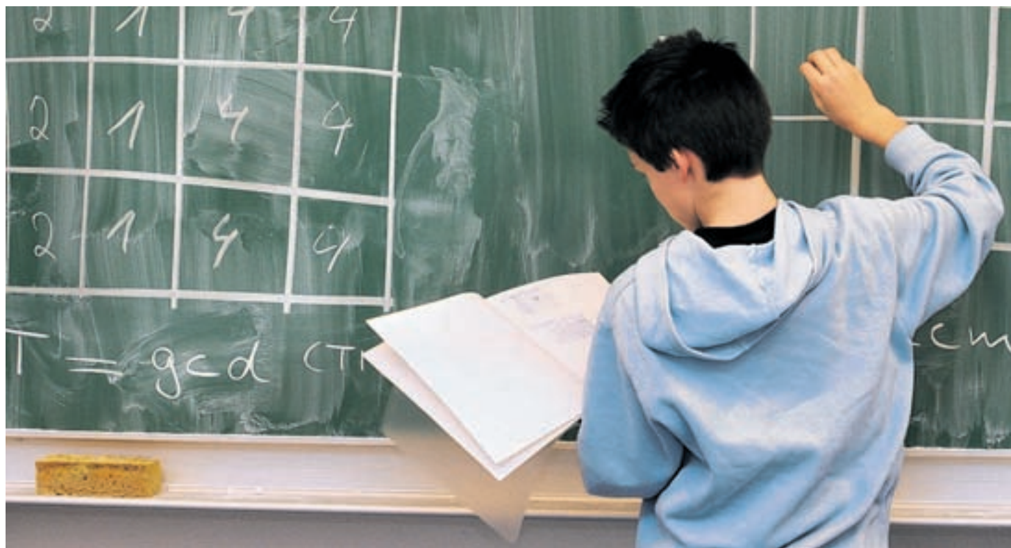
Anpassung. Der Baselbieter Landrat stellte gestern Weichen in Richtung einheitlicheres nationales Schulsystem.

Schwieriger als zu Harnos ist es, eine Prognose darüber zu stellen, wie der Landrat kommende