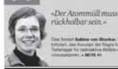
«Der Atommüll muss rückholbar sein.»

Das ist ein Schuss, der die Grenzlinie nach Süd über die Grenze in den grossen Teil der Schweiz über eine Zeit, was die Schweizer Regierung... Anfang 2008 hat die dreistufige Auswahlverfahren für zwei Tiefenlager begonnen. Im Frühling 2009 schlug das Bundesamt für Energie (BFE) und die Nationale Genossenschaft für die Lagerung radioaktiver Abfälle Nagra sechs Regionen für die Lagerung vor: Südlicher Oberrhein (SO), Nördlich Lägeren (NL), Bözberg (BZ), Jura-Südost (JS), Weissenberg (W) und Südlicher Oberrhein (SO).